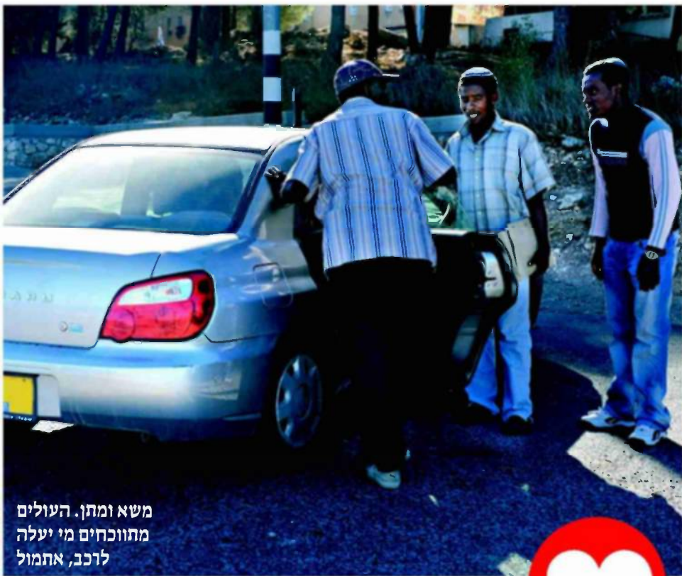
משא ומתן. העולים מחווכחים מי יעלה לרכב, אתמול