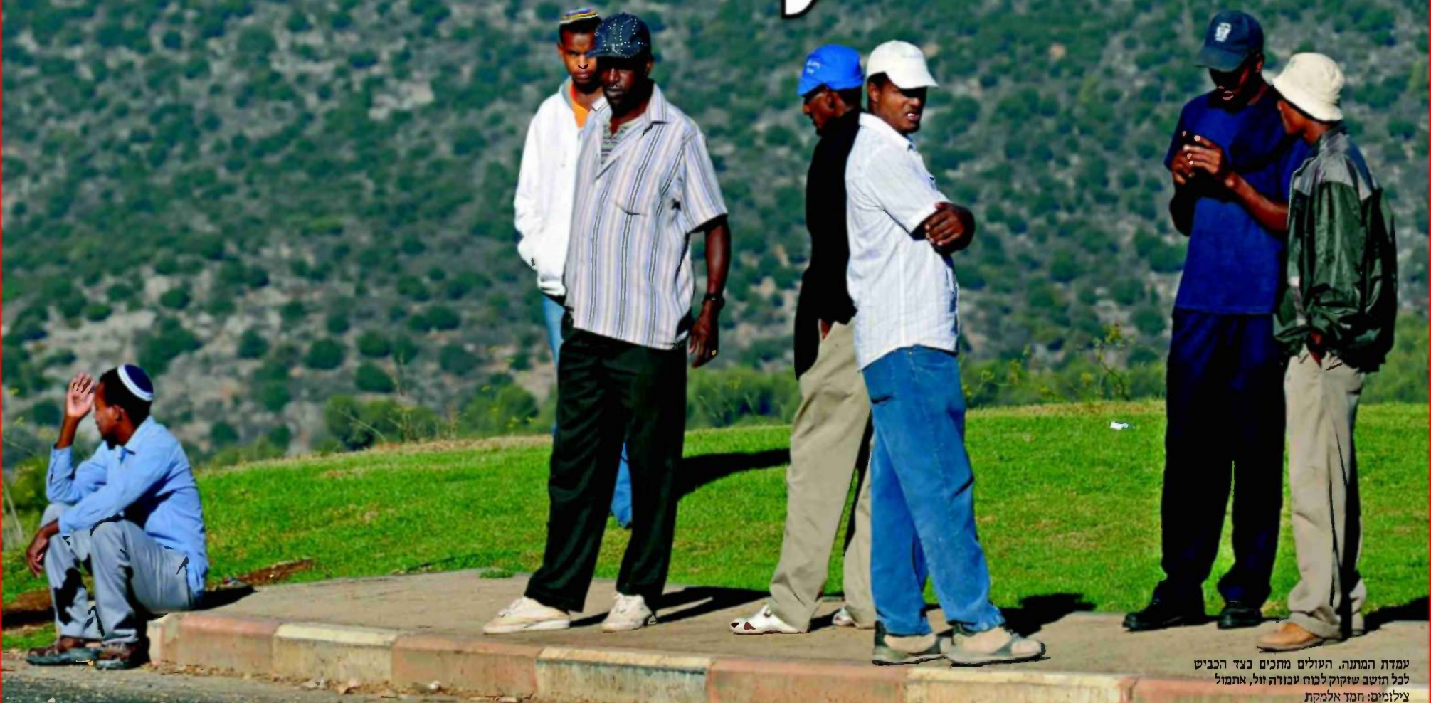
עמדת המתנה. העולים מחכים בצד הכביש לכל תושב שזקוק לכוח עבודה זול, אתמול