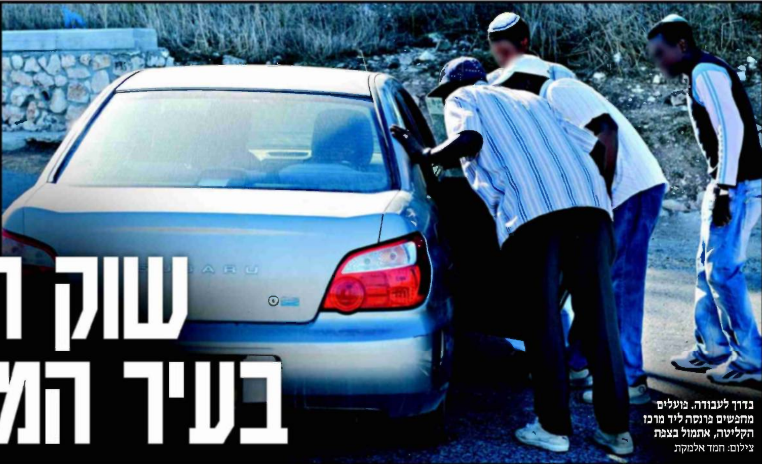
בדרך לעבודה. פועלים מחפשים פרנסה ליד מרכז הקליטה, אתמול בצפת

בפינת רחוב בצפת עומדים מדי יום עשרות עולים יוצאי אתיופיה מובטלים ■ תושבי האזור שמחפשים לנצל כוח עבודה זול אוספים אותם לעבודות מזדמנות ■ לפעמים הם אפילו לא משלמים להם שכר ■ יובל גורן, עמ' 2